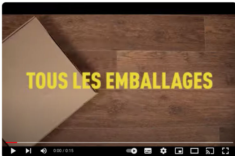
Extension des consignes de tri - été 2023

La vidéo la plus vue de l'année : www.youtube.com/watch?v=j4K01m4ulal