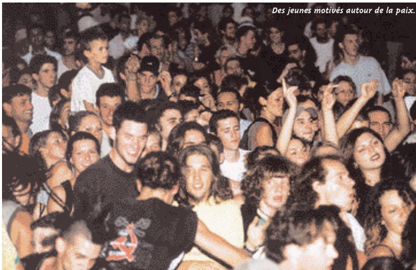
Des jeunes motiv s autour de la paix.