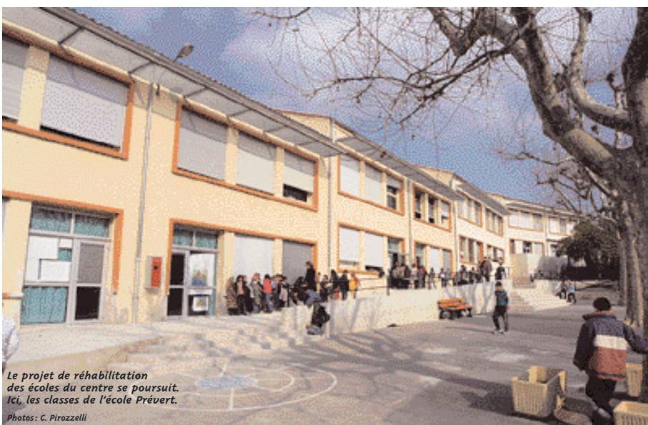
Le projet de réhabilitation des écoles du centre se poursuit. Ici, les classes de l'école Prévert.

Pour les enfants en grandes difficultés scolaires, des classes d'intégration (CLIS) ont été créées et fonctionnent avec un effectif maximum de 12 élèves. Il en existe une à Bayet, une à Prévert et une à Biver. Les enfants qui évoluent dans ces classes adaptées à leurs besoins viennent de toute la circonscription scolaire. Un autre mode de soutien sco-