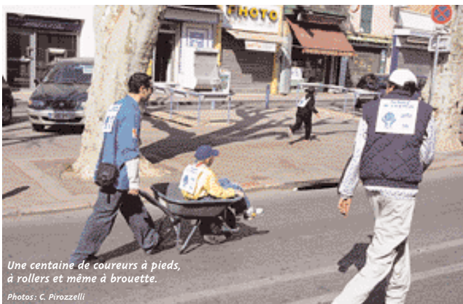
Une centaine de coureurs à pieds, à rollers et même à brouette.