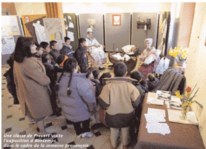
Une classe de Prévert visite l'exposition à Bontemps, dans le cadre de la semaine provençale.