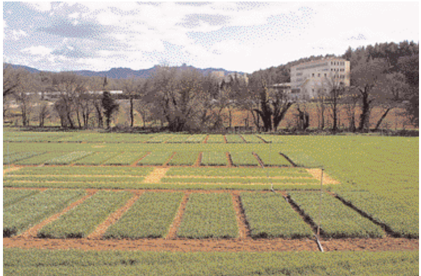
Les friches représentent une quarantaine d'hectares qu'il faudrait valoriser.

Le rapport de la Chambre d'agriculture se termine par une série de propositions à débattre : agir dans le cadre du futur Plan local d'urbanisme (le nouveau nom du POS) pour préserver et étendre les zones agricoles existantes, lutter contre le mitage (petites parcelles dispersées), réhabiliter les 40 hectares de friches qui seraient utiles aux agriculteurs souhaitant s'étendre, mettre à disposition des hangars agricoles loués par la commune aux exploitants, créer un partenariat étroit avec la SAFER