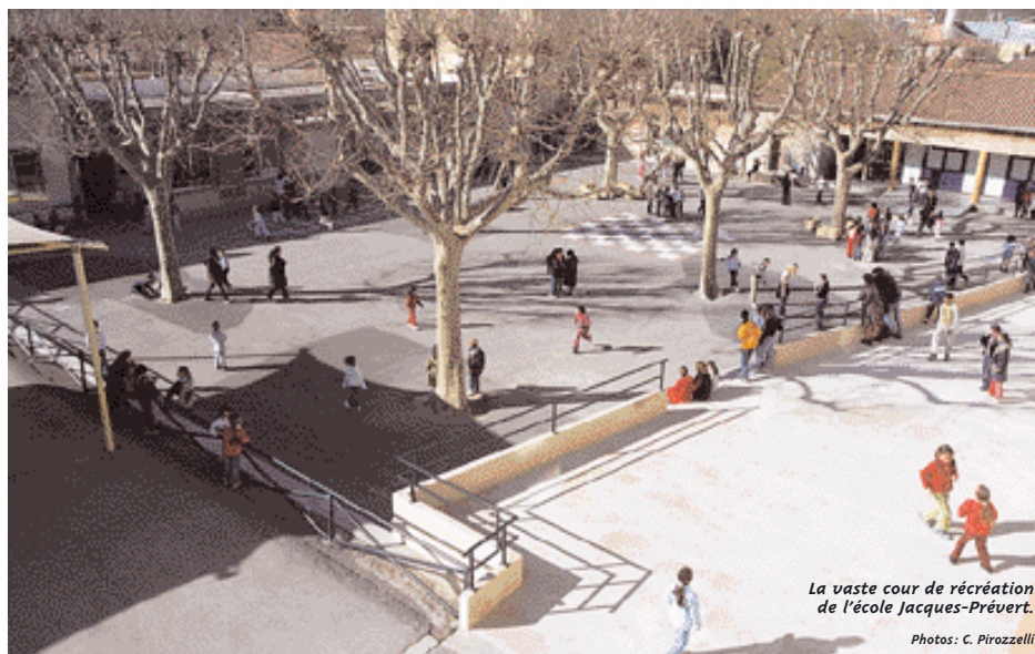
La vaste cour de récréation de l'école Jacques-Prévert.