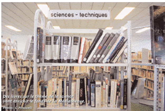
Des livres sur le thème de la science vont enrichir le fonds de La Médiathèque.

N° 38 - Dotation globale d'équipement des communes et de leurs groupements pour l'année 2004.