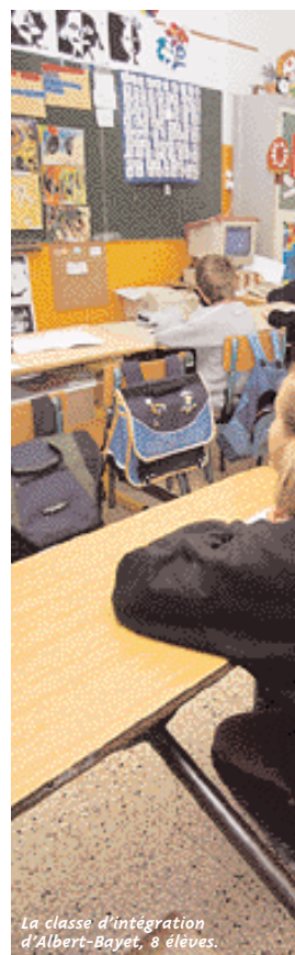
La classe d'intégration d'Albert-Bayet, 8 élèves.