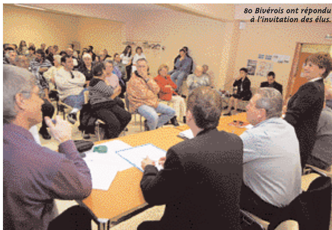
80 Bivérois ont répondu à l'invitation des élus.

Le 17 mars dernier, les riverains du boulevard Savio, des rues des Géraniums et des Glaïeuls étaient invités par la municipalité à discuter du projet de mise à sens unique de ces rues et de création de places de stationnement. Près de 80 personnes y ont assisté. Les échanges entre les riverains et les élus ont été fructueux, il y aura bien cette mise en sens unique, mais le traçage au sol des places a été abandonné : « Je pense que cela risque de poser plus de problèmes qu'autre chose, souligne une habitante. Nous avons pris l'habitude de vivre comme ça dans le quartier, un jour nous nous garons devant chez le voisin, le lendemain, c'est lui qui se met devant chez nous. » Certains habitants ont souhaité que la municipalité équipe le boulevard Savio de dos d'ânes, proposition que d'autres ont rejetée après avoir pris conscience que le bruit qu'ils occasionnent pouvait très vite devenir insupportable. « La police municipale sera particulièrement attentive à ce que la vitesse comme le sens de circulation soient respectés, » a souligné Yveline Primo, première ad-