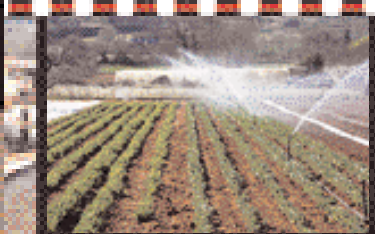
Visite à Maillane, p4