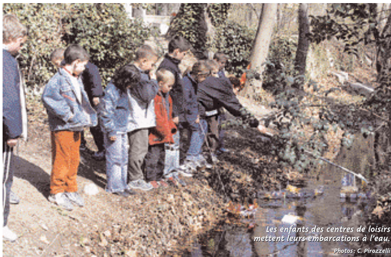
Les enfants des centres de loisirs mettent leurs embarcations à l'eau.