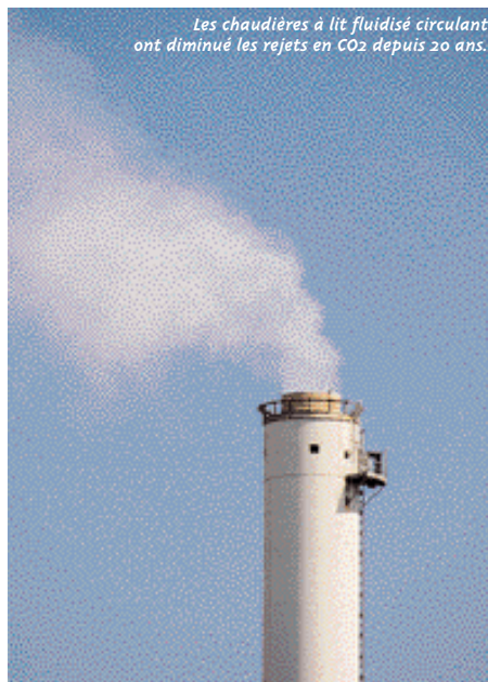
Les chaudières à lit fluidisé circulant ont diminué les rejets en CO 2 depuis 20 ans.

répondre par le même moyen en fonction de ce qu'ils constatent. La limite de la chose, c'est évidemment qu'Airmaraix, en tant qu'association de surveillance de la qualité de l'air, n'a pas vocation à intervenir. Sa mission est de collecter l'information et de la transmettre aux autorités compétentes, mais aussi à informer le public, par le biais de son site internet ( www.airmaraix.com ). Le Plan de protection de l'atmosphère, qui sera mis en place par la Préfecture au printemps 2004, amorce quelques pistes intéressantes : des contrôles techniques gratuits et annuels pour les véhicules diesel non catalysés, la gratuité des péages autoroutiers (pour les véhicules transportant au moins trois personnes) et des transports publics en période d'alerte à l'ozone ou encore la réduction des émissions de benzène pour les industries les plus polluantes. Parce qu'observer, c'est bien, mais agir, c'est mieux.