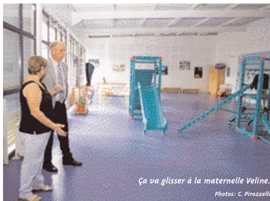
Ça va glisser à la maternelle Veline.

Hormis les quelques larmes versées, la rentrée scolaire 2003 s'est déroulée sans heurts. Les 1964 enfants inscrits en maternelle et en primaire ont pu sereinement reprendre le chemin des treize écoles de Gardanne. La hausse des inscriptions enregistrée cette année - quarante demandes supplémentaires en mater-