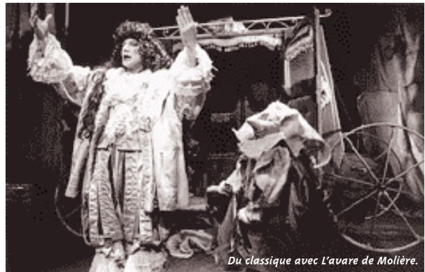
Du classique avec L'avare de Molière.