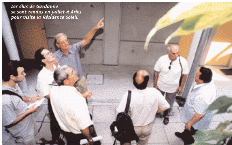
Les élus de Gardanne se sont rendus en juillet à Arles pour visiter la Résidence Soleil.