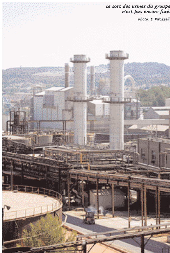
Le sort des usines du groupe n'est pas encore fixé.

Légalement le ministère des Finances avait aussi son mot à dire. Bercy doit se prononcer sur tout investissement étranger touchant de près ou de loin à la défense nationale, Pechiney livre des produits à l'industrie aéronautique. Mais, on voyait mal l'actuel gouvernement, d'inspiration libérale, trancher par la négative alors qu'il y a trois ans le gou-