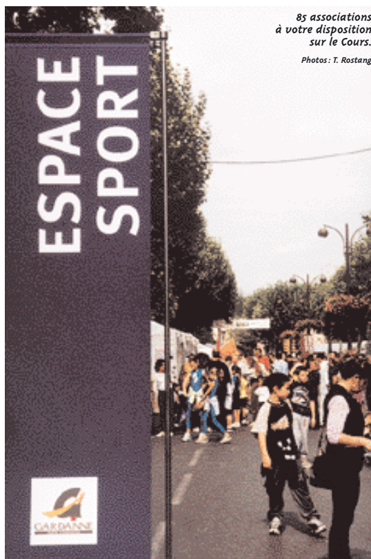
85 associations à votre disposition sur le Cours.