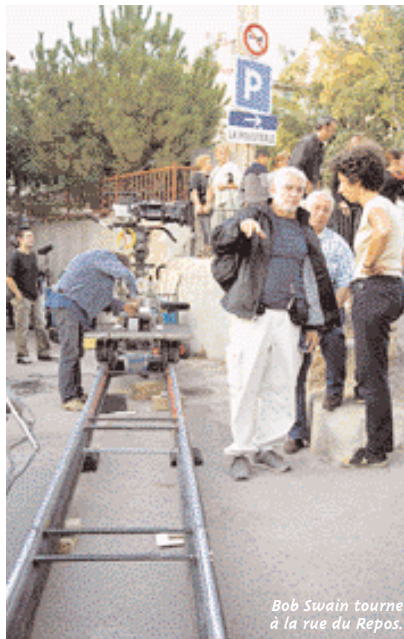
Bob Swaim tourne à la rue du Repos.

Une 806 de la police, l'aile avant droite enlevée, descend la rue Franklin et freine dans un crissement de pneus. Deux hommes et une femme en descendent. Ils approchent d'une BMW arrêtée au milieu de la rue du Repos. L'un des policiers tente d'ouvrir la portière, n'y parvient pas, casse la vitre, desserre le frein à main. La BMW dévale la pente et vient s'encaster vingt mètres plus bas dans une voiture blanche garée contre un mur. L'action, qui ne devrait pas durer plus d'une minute, vous devriez la voir au cinéma au printemps 2004, dans un polar intitulé Tranquille! Elle aura été tournée dans la nuit du 1 er au 2 septembre, dans la vieille-ville, par le réalisateur Bob Swaim ( La Balance ) et les acteurs Frédéric Diefenthal ( Taxi ), Armelle Deutsch et Atmen Khelif. Daniel Auteuil (qui a débuté au cinéma en 1976 sous la direction de Bob Swaim) fait également partie de la distribution, mais n'était pas présent à Gardanne. Une autre scène a été tournée la même nuit sur le Cours, complètement fermé à la circulation. Commencé début août à l'école des beaux-arts de Luminy, le tournage est passé par le centre-ville de Trets, Berre et une boîte de nuit à Marseille. Il devrait s'achever fin septembre.