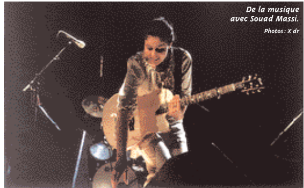
De la musique avec Souad Massi.

le mercredi, un nouvel horaire sera testé le samedi après-midi à 14h30. Première date à retenir : le samedi 18 octobre à la Maison du Peuple. Le Théâtre Mu y présentera Péplum poids plume . Un spectacle où, sur fond de dénonciation de la tyrannie, de l'esclavage et du racisme, les objets sont à l'honneur. L'autre nouveauté concernant les plus jeunes s'appuie sur le lancement de l'opération Mon anniversaire au théâtre . Au lieu d'aller manger un hamburger, les enfants sont invités à venir déguster une pièce de théâtre en com-