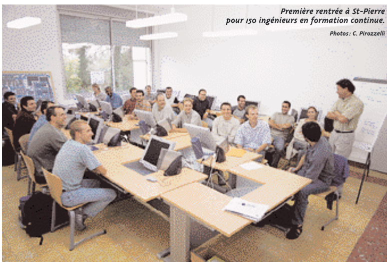
Première rentrée à St-Pierre pour 150 ingénieurs en formation continue.