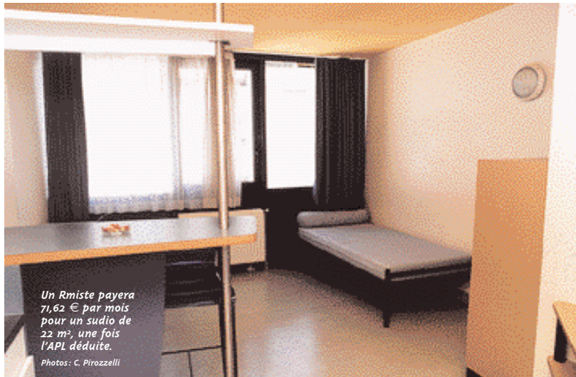
Un Rmiste payera 71,62 € par mois pour un studio de 22 m 2 , une fois l'APL déduite.