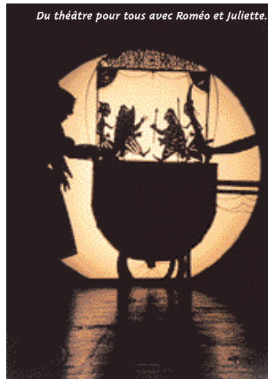
Du théâtre pour tous avec Roméo et Juliette.

pagnie d'une dizaine de copains. Les bougies et le gâteau, préparés par les parents, les attendent à la fin du spectacle.