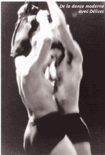
De la danse moderne avec Délices

Côté jeune public, sept spectacles ont été programmés à l'attention des tous petits. Entre les séances scolaires et celles ouvertes au public, l'idée est toujours de sensibiliser les enfants dès leur plus jeune âge. Pour permettre à ceux dont les parents travaillent