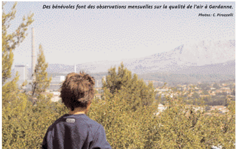
Des bénévoles font des observations mensuelles sur la qualité de l'air à Gardanne.

Cette année, un projet a été testé à Rognac : c'est la surveillance des odeurs par SMS. Dans une zone où elles sont particulièrement gênantes, les riverains peuvent être alertés par un SMS sur leur téléphone portable, et