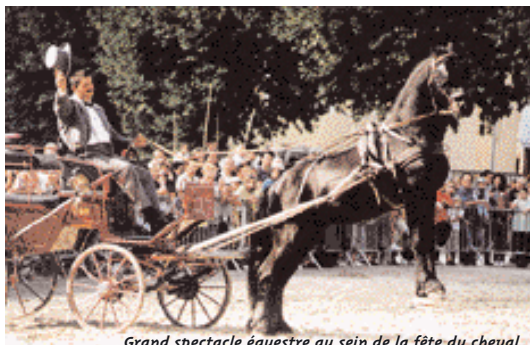
Grand spectacle équestre au sein de la fête du cheval.

GARDANNE, LES 28 ET 29 SEPTEMBRE. Un week-end des plus animés s'annonce pour cette fin septembre. Le samedi 28, on retrouve la foire de la Saint-Michel dont la tradition remonte à plusieurs dizaines d'années. Organisée par le service municipal du développement économique, elle se déroulera sur le boulevard Carnot de 10h à 18h. Quarante exposants viendront présenter leurs produits régionaux et artisanaux (miel, vins, fromages, huiles, épices, poteries, tissus, vêtements, divers objets de décoration...), tandis que les animaux de la ferme pédagogique d'Allauch et les chevaux des ranchs de la commune divertiront jeunes et moins jeunes. Le lendemain, c'est la fête du cheval et du poney organisée par l'Office de Tourisme qui prend le relais. Au programme, des baptêmes à poneys dès 10h, une grande cavalcade dans les rues de la ville à 14h30 et un spectacle équestre (défilé, voltige, mise en scène...) sur l'esplanade du collège Gabriel-Péri à 15h. Cavaliers et chevaux du ranch Pénélope , du centre équestre de Mimet , du centre équestre Sainte-victoire , et de l'association Poney speed seront de la fête.