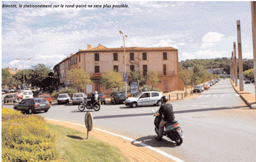
Bientôt, le stationnement sur le rond-point ne sera plus possible.

Le mois prochain débiteront les travaux de construction d'un nouveau parking aux abords du boulevard Victor-Hugo, sur un terrain que la municipalité a racheté à Pechiney. Dans cet espace, proche du centre-vil-