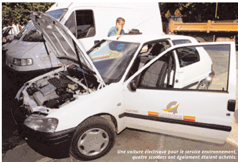
Une voiture électrique pour le service environnement, quatre scooters ont également été achetés.