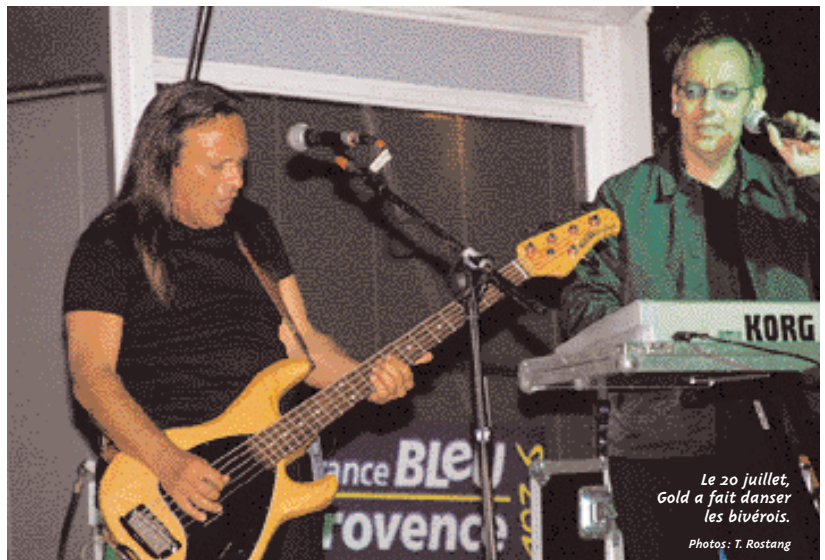
Le 20 juillet, Gold a fait danser les bivérois.