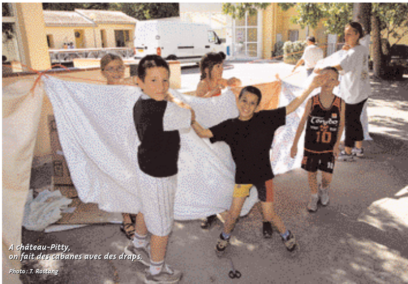
A château-Pitty, on fait des cabanes avec des draps.