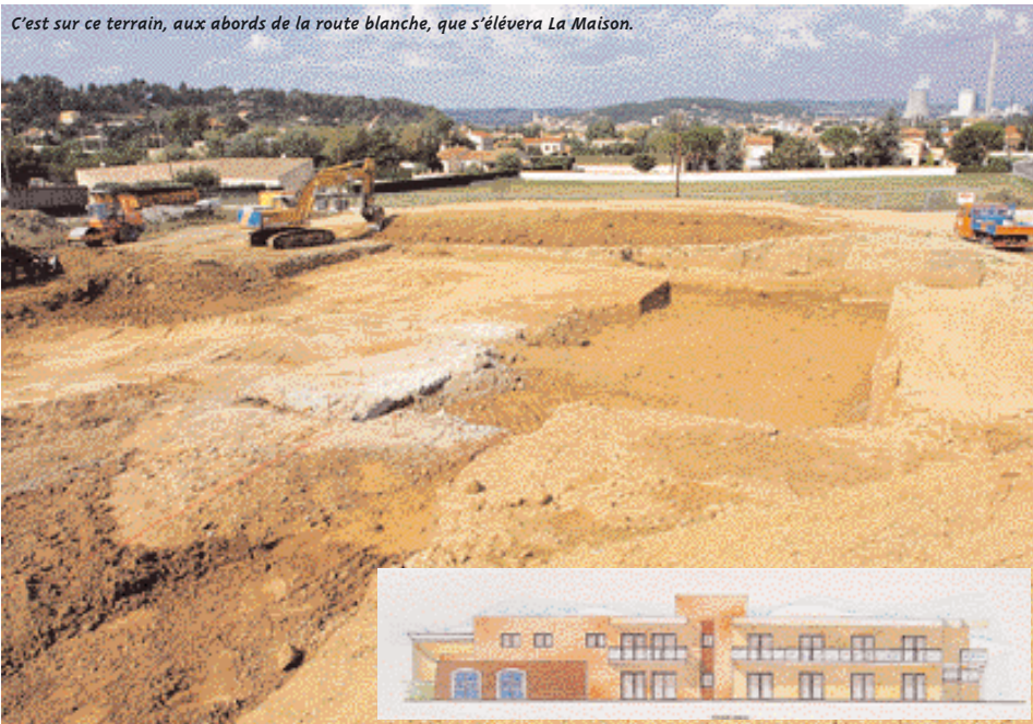
C'est sur ce terrain, aux abords de la route blanche, que s'élèvera La Maison.

nuerons à travailler en équipe, à partager la réflexion, à avancer ensemble. » Quant à l'esprit Maison qui leur colle à la peau, il fera partie intégrante du déménagement. Le