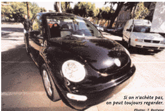
Si on n'achète pas, on peut toujours regarder.

GARDANNE, DU 1ER AU 3 OCTOBRE. Pour la quatrième fois, l' Union commerciale organise un Salon de l'automobile et accessoires . Sur le cours de la République, le mardi 1 er , mercredi 2 et jeudi 3 octobre, vous découvrirez les nouveautés 2002 présentées par treize concessionnaires et agents, et tout ce qu'un conducteur prévoyant doit avoir à portée de main dans son