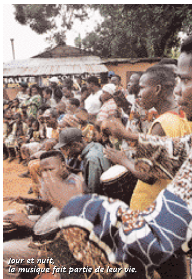
Jour et nuit, la musique fait partie de leur vie.

tendaient leurs enfants pour qu'on les ramène en France...» Et ça... Et... Et... Quand est-ce qu'on y retourne ?